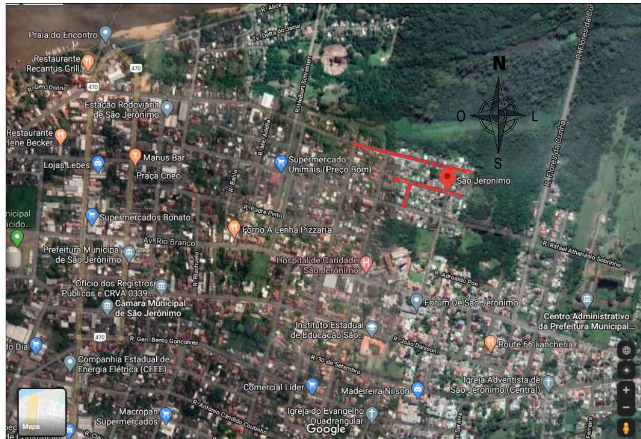
SITUAÇÃO SEM ESCALA